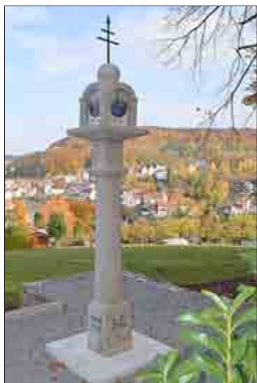
Zu einem wahren Schmuckstück wurden der Aschberg-Bildstock und das Umfeld.