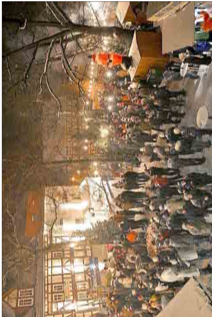
Bild vom Weihnachtsmarkt in Diedorf