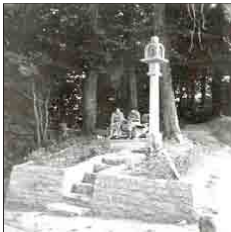
So sah der Aschberg-Bildstock um 1960 aus.