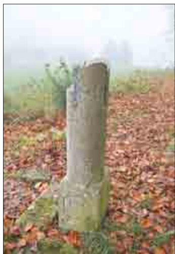
Vor etwa einem Jahr bot sich dieses traurige Bild von der abgebrochenen Bildsäule.