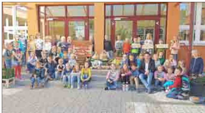
Text und Bilder: Christian Fischer, Elternsprecher